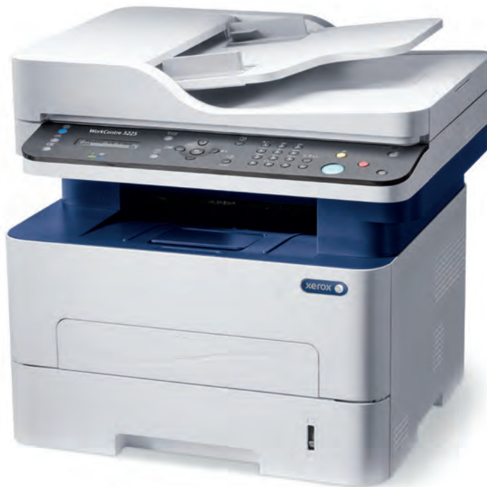
WorkCentre 3225. Copie. Impression. Numérisation. Télécopie. Courrier électronique.