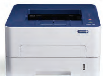
Phaser 3260. Impression