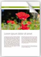
Impression couleur normale