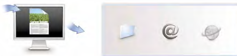
Fonctions « Scan to e-mail », « Scan to folder » et « Scan to URL » accessibles par simple appui sur un bouton