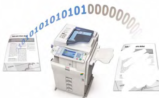
HDD Data Overwrite.

Les fonctions d'authentification et de cryptage protègent vos données confidentielles. Les MP C2050/MP C2550 sont compatibles avec des logiciels de sécurité en option tels que HDD Data Overwrite, Data Security for Copying, Card Authentication et Secure Print Release.