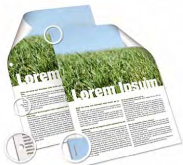
Agrafe et perfore vos documents.

Un finisseur 500 feuilles intégré a été spécialement développé pour les MP C2050/MP C2550. Il vous permet d'agrafer et de perforer vos documents. Vous disposez ainsi du partenaire de production de documents professionnels idéal offrant une excellente qualité d'impression et un remarquable traitement des supports. Grâce à lui, vous limitez la sous-traitance de vos documents et produisez en interne de nombreux documents de qualité professionnelle.